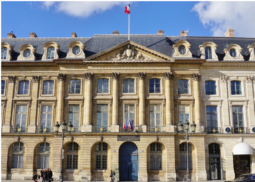
Le ministère de la Justice, place Vendôme, à Paris.

impliqueront une présence physique de l'ensemble des parties en cause et de leurs conseils.